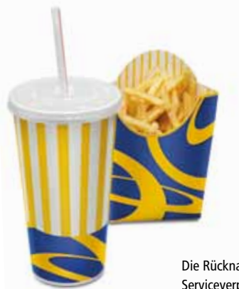
Die Rücknahme befüllter Serviceverpackungen kann an die Hersteller oder Vorvertreiber delegiert werden.